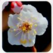
豊後 大輪で珍しい淡い紅色