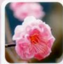
楊貴妃 フリルが華やか八重咲