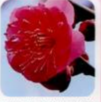
鹿児島紅 鮮やかな紅色が美しく植木で人気