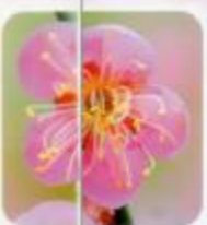
道知辺 芳香が強いので夜間でも分かるが由来