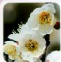
白加賀 梅干しになる定番