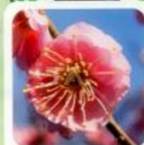
未開紅 開花のときに一、二弁が咲き遅れる