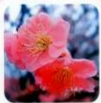
鶯宿 おしどりの名が由来、1枝に実が2つ