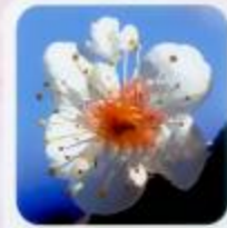
初雁 早い時期から楽しめる