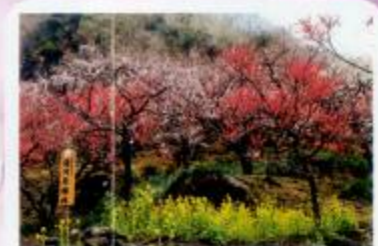
梅のアーチ 梅と菜の花競演も楽しんで