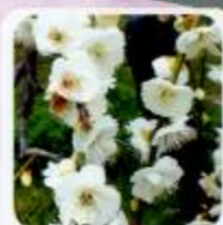
緑萼枝垂 白と緑のコントラストがきれい