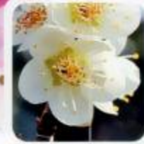
月影 香りが強く蕾がモスグリーン