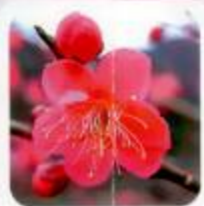
紅千鳥 万葉集に多く詠まれている