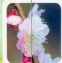
藤牡丹 大輪八重咲