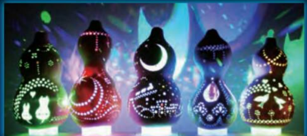
▲ひょうたんライトを作ってみよう!